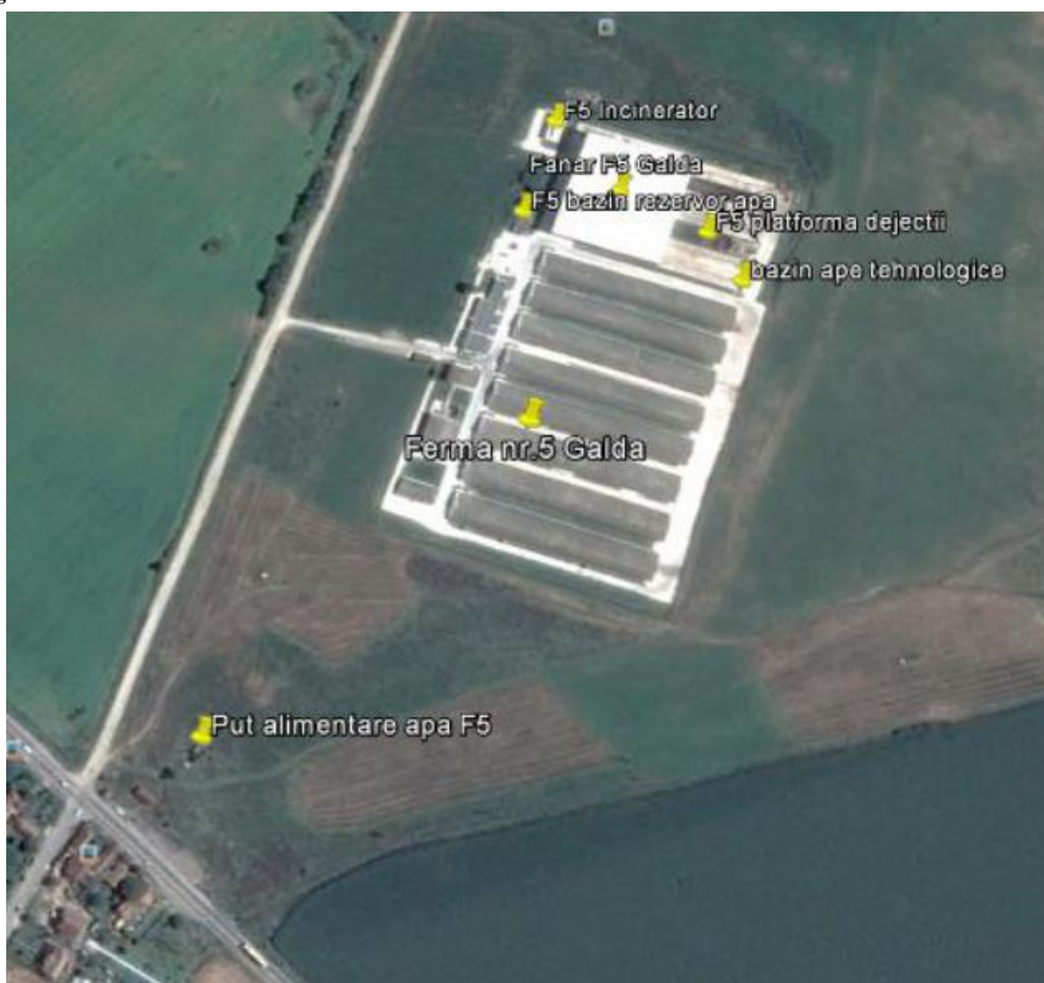
Figura 2: Incadrarea in zona a Fermei 5 Galda de Jos